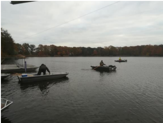
De vloot op weg