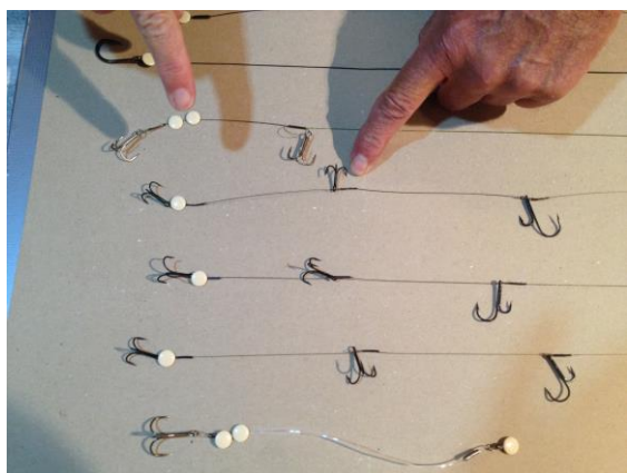
Het 'Takelbord' van Hans

Ook de verschillende te gebruiken systemen werden door de 'sluwe vos' minutieus uit de doeken gedaan. Al met al weer een erg leerzame en gezellige avond.