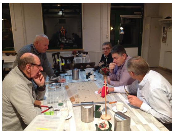
Natuurlijk was er ruimte voor discussie