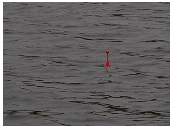
Hij wilde maar niet vertrekken