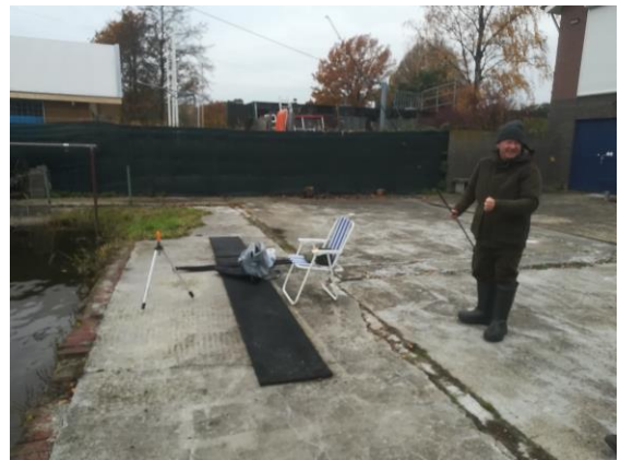
Of van de kant