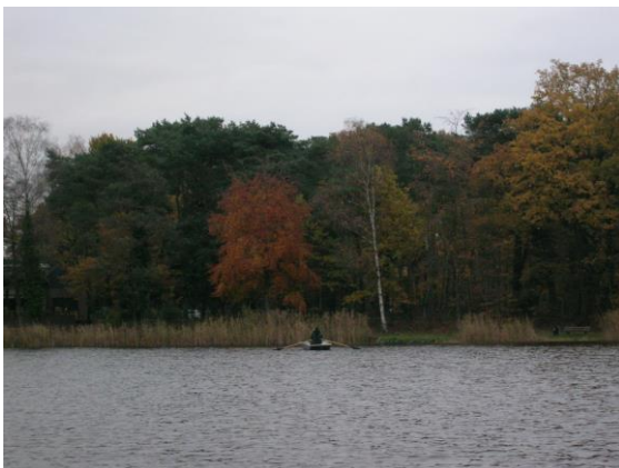
Ook de kantjes uitvissen