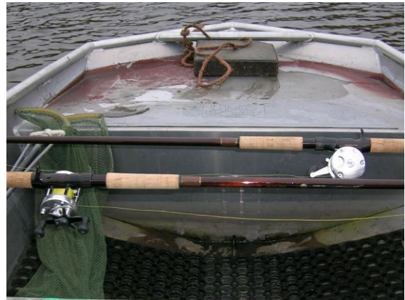
Aan het materiaal zal het niet liggen